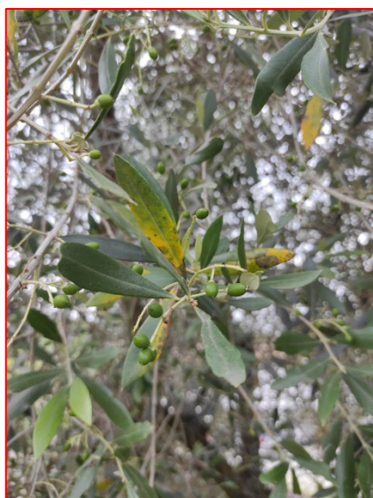
Attacco di occhio di pavone-areale sebino