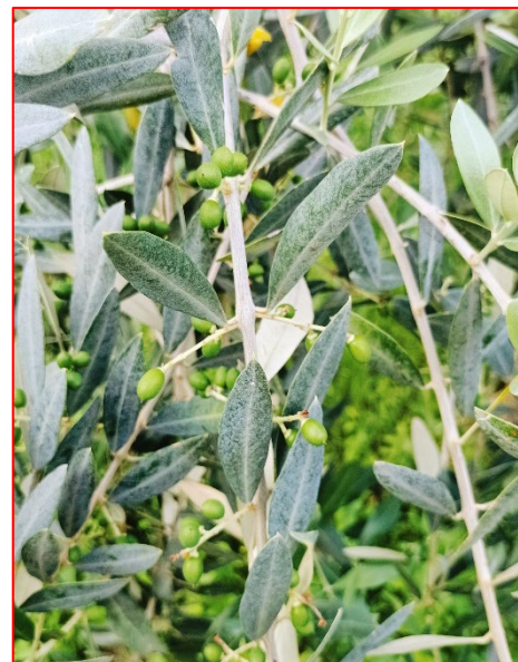
Fase fenologica rilevata - Areale Garda

N.B. Per i trattamenti fitosanitari seguire sempre le dosi d'etichetta e rispettare i tempi di rientro e di carenza e tutti gli accorgimenti per un corretto uso dei P.F.