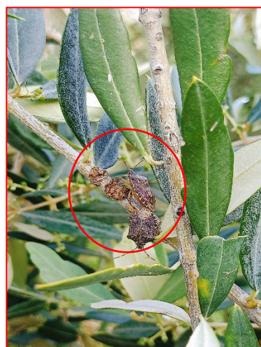
Adulti di cimice asiatica

Programma di Sviluppo Rurale 2014 - 2020 Fondo Europeo Agricolo per lo Sviluppo Rurale –Misura 19 - OPERAZIONE 19.3.01 “Cooperazione interterritoriale e transnazionale”