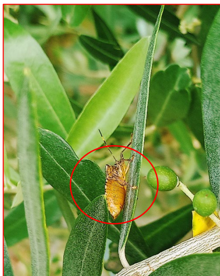
Adulto di cimice asiatica- Valtinesi