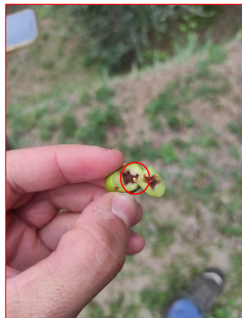
Attacco di mosca dell'olivo su drupa di leccino--areale Sebino