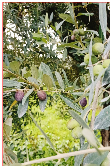
Olive a inizio invaiatura varietà leccio- areale Garda