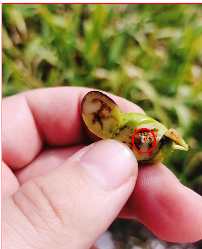
Larva di seconda età di mosca dell'olivo- areale Garda