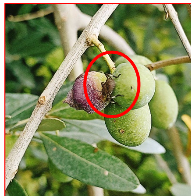
Ninfa di prima età di cimice asiatica - areale Garda