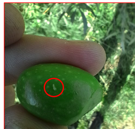
Larva di prima età di mosca dell'olivo- areale Lario