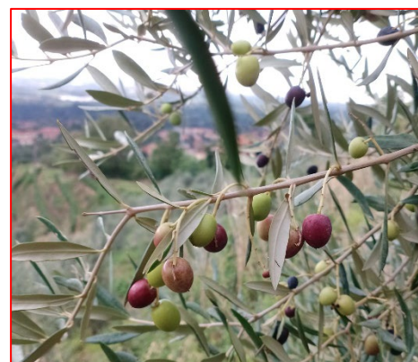
Inizio d'invaiaura per la varietà maurino -areale Lario