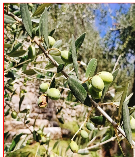
Fase fenologica -areale Garda

Dato il superamento delle soglie d'intervento per mosca dell'olivo (2-3 olive con presenza di uova o larve, su 100 controllate), si esortano gli olivicoltori in tutto l'areale a monitorare la presenza di punture fertili e a intervenire con prodotti ovo-larvicidi se le soglie d'intervento già citate siano state superate nei propri oliveti , si allega ancora lo speciale sulla lotta curativa alla mosca .