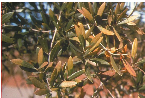
Sintomi di Boro Carenza