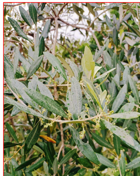
Inizio di Mignolatura