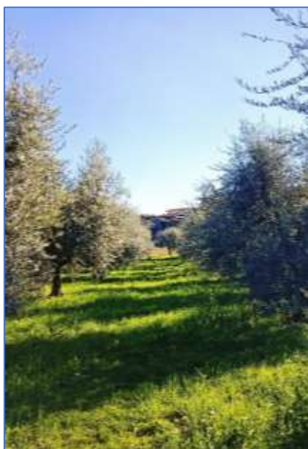
Oliveto in Valtènesi