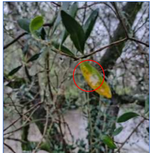
Segni d'infezione da occhio di Pavone– Alto Garda

La presenza di Occhio di Pavone su foglia risulta essere in aumento grazie alle temperature miti soprattutto in quei microclimi locali più umidi (Valtinesi e Basso Garda). L'aumento delle temperature e le recenti piogge stanno cominciando a creare le condizioni idonee allo sviluppo delle infezioni di questa malattia che svolge il suo ciclo a carico delle foglie dell'olivo.