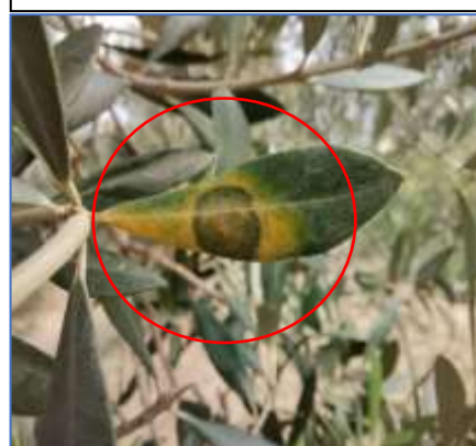
Tipici sintomi d'infezione da occhio di Pavone- Areale Gardesano

La connotazione meteorologica di queste settimane è stata di clima mite intervallato da alcuni giorni di maltempo , ad oggi l'inverno è risultato molto mite. La fase fenologica rilevata è riposo vegetativo per tutte le varietà. Le infezioni di occhio di pavone ( Spilocaea oleaginea ) , risultano essere eterogenee sul territorio e variabili a seconda del microclima zonale .