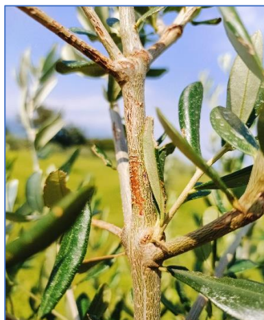
Rosura causata da ortotteri su giovane pianta di olivo -Valtenesi

Si raccomanda di effettuare con regolarità, gli sfalci degli oliveti con inerbimento permanente, in modo da controllare agevolmente le infestanti. I costanti temporali e le alte temperature stanno creando un microclima favorevole alle malattie fungine e lo sfalcio costante del cotico erboso in uliveto costituisce un mezzo agronomico volto al contenimento dei patogeni fungini. Si ricorda che nel caso non si fosse intervenuto nelle zone colpite da grandine è consigliato svolgere un trattamento a base di prodotti rameici o utilizzando prodotti a base di Bacillus subtilis per difendere le ferite dal batterio della Rogna, soprattutto sulle varietà particolarmente sensibili (Casaliva).