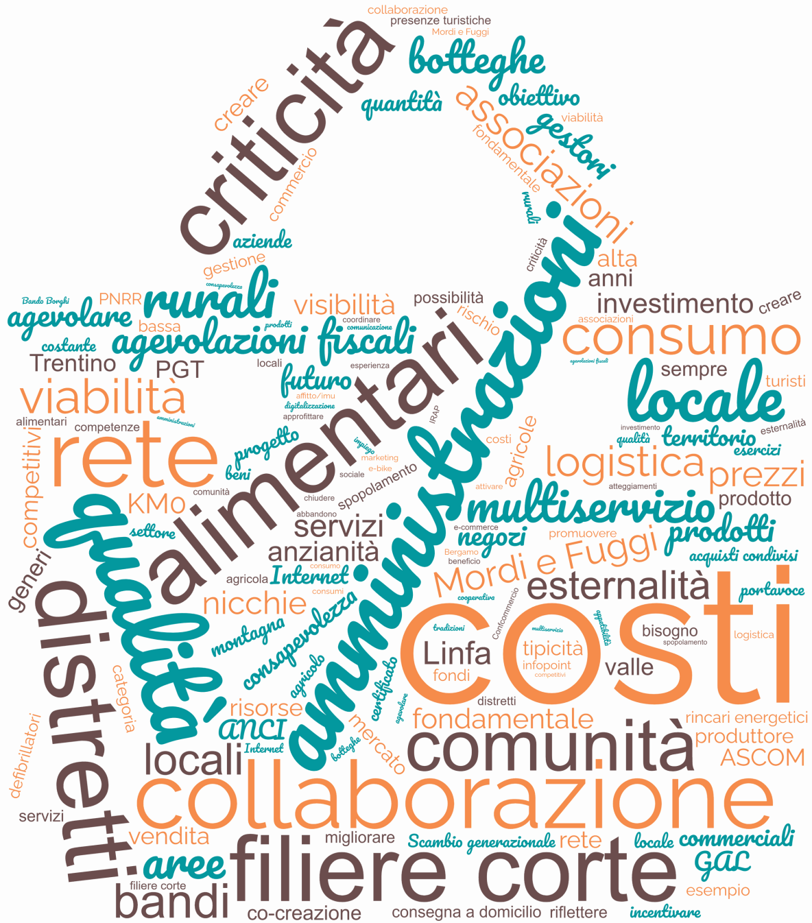
Fig. 1 Wordcloud con le riflessioni emerse durante il secondo focus group (produzione propria).