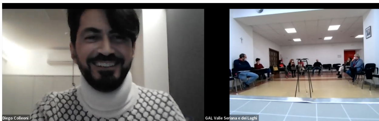
Fig. 2 Screenshot del terzo incontro in modalità mista (produzione propria).

Il GAL Valle Seriana e dei Laghi Bergamaschi insieme agli altri due GAL Partner si impegnerà a portare a termine il progetto offrendo tutti gli strumenti possibili affinché la bottega di montagna venga riconosciuta come presidio sociale fondamentale per le terre alte.