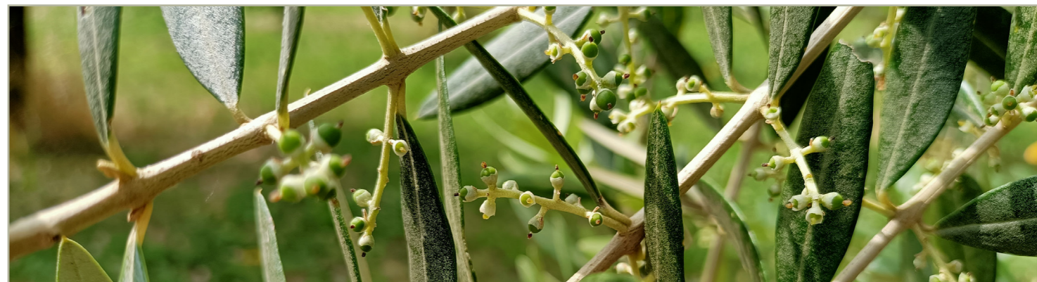
STADIO FENOLOGICO NELL'AREALE GARDESANO

Si raccomanda di effettuare un'irrigazione di soccorso soprattutto nei giovani impianti. Effettuare gli sfalci del manto erboso per evitare competizioni idriche. IN CASO DI CARENZE DI BORO, SI CONSIGLIA DI EFFETTUARE INTERVENTI DI CONCIMAZIONE FOGLIARE CON QUESTO ELEMENTO NELLA FASE DI POST ALLEGAGIONE.