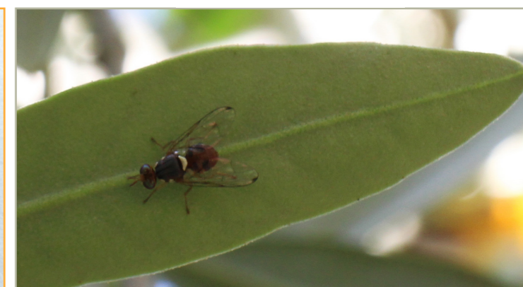
MOSCA DELL'OLIVO - BACTROCERA OLEAE