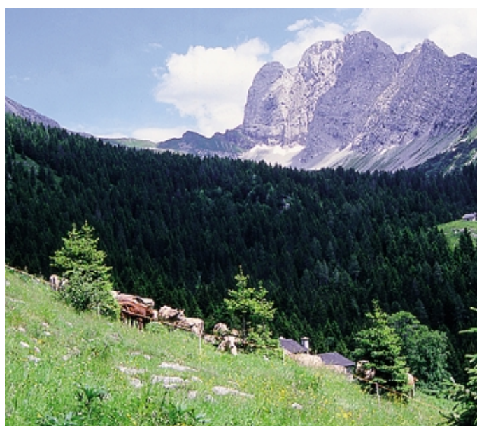
Sempre più interventi di sviluppo rurale, anche in chiave turistica